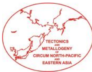
ГРАФИК КОНФЕРЕНЦИИ (возможны изменения)