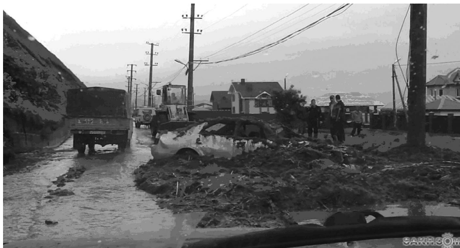
Рис. 3. Последствия схода оползня-сплыва в г. Невельск, 2010 г..

до 50 м и более, объем – более 1.0 млн м 3 . Данный тип оползней получил наибольшее развитие на оползневых отложениях как вторичные оползни. Глубина захвата – элювиально-делювиальные отложения. Наиболее интенсивно развиваются на морских побережьях.