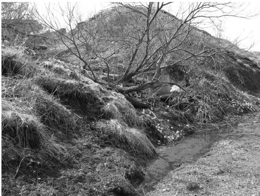
Рис. 2. Коллекторные колодцы в г. Холмске, расположенные на активном оползне вязкопластического течения. Поверхность оползня задернована. 2012 г. (фото Казаковой Е.Н.).

В то же время, сейсмогенная активизация оползневых процессов проявляется как отложенный эффект: во время сильных землетрясений происходит образование глубоких трещин на поверхности оползневых массивов в скальных породах, в которые на протяжении последующих лет затекают поверхностные воды (преимущественно, атмосферные осадки). Длительное увлажнение потенциальных поверхностей скольжения оползней на контакте между согласно залегающими пластами скальных пород приводит впоследствии к формированию в скальных породах блоковых оползней больших объемов.